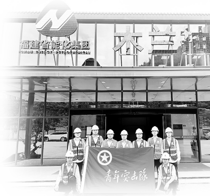
图为木兰抽蓄公司青年突击队合影

在福建莆田仙游县社硎乡与菜溪乡的交界之处,戴云山脉的层峦叠嶂间,一座承载着福建电网调峰填谷与新能源消纳重任的“绿色充电宝”——仙游木兰抽水蓄能电站,正拔地而起。